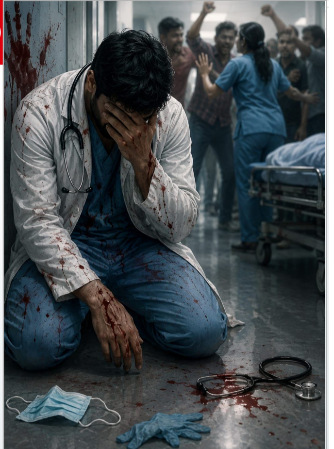
సామాజిక మార్పు అవసరం...